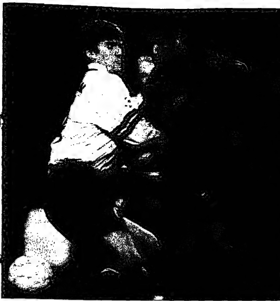
ديفيد ميلر يفرح بكرة (اليمين) يصنع لاعب يوفنتوس بيير فينسينس على الكرة (اليسار)